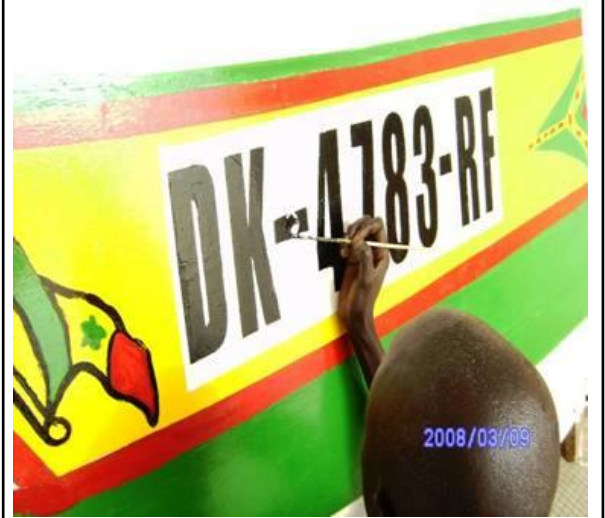
PNI Sénégal: mise en place du marquage à la peinture et du tag permettant le contrôle d'identification électronique